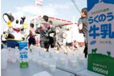
「ミルモくん」も応援に駆けつけました！

JA 熊本市は2月18日に開かれた「熊本城マラソン 2024」で、給食・給水ボランティア活動に参加しました。JAは地域貢献活動の一環として、毎年協力しています。JA熊本市「夢未来」農産物やジュシー、らくのう製品などを提供し、ひたむきに駆け抜けるランナーを応援しました。