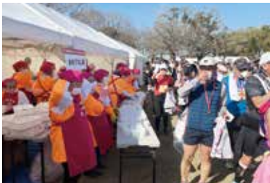
会場のみそ汁を渡す女性部員

また、ゴール地点である熊本城二の丸広場では、女性部の手作りみそを使ったみそ汁を用意し、完走したランナーに労いの言葉をかけました。受け取ったランナーからは感謝の言葉と笑顔であふれ、会場は多くの人で賑わいました。