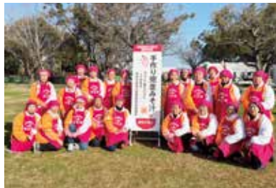
みそ汁を振る舞った「おもてなし隊」