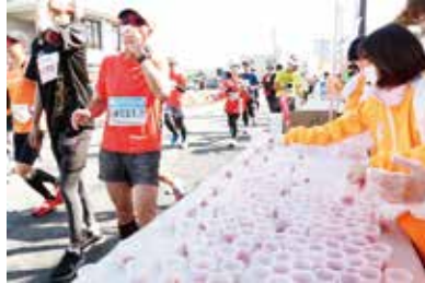
「夢未来」農産物は「おいしい！」と大好評でした

また、ゴール地点である熊本城二の丸広場では、女性部の手作りみそを使ったみそ汁を用意し、完走したランナーに労いの言葉をかけました。受け取ったランナーからは感謝の言葉と笑顔であふれ、会場は多くの人で賑わいました。