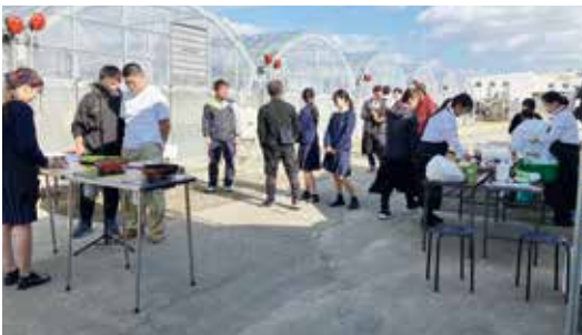
現場監督から撮影まで高校生が主体となり頑張りました