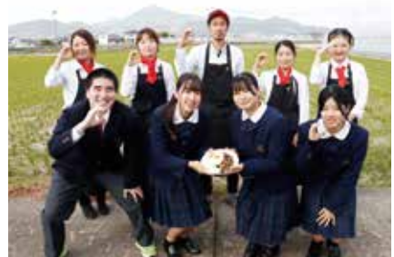
動画たくさん見てくださいな！